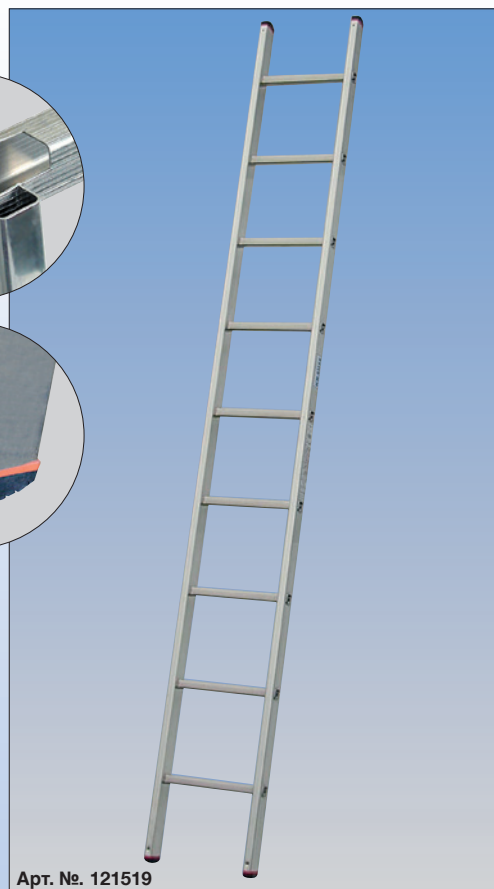
Арт. №. 121519