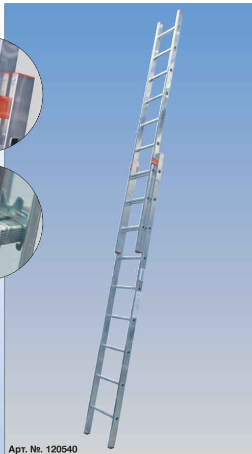
Арт. №. 120540