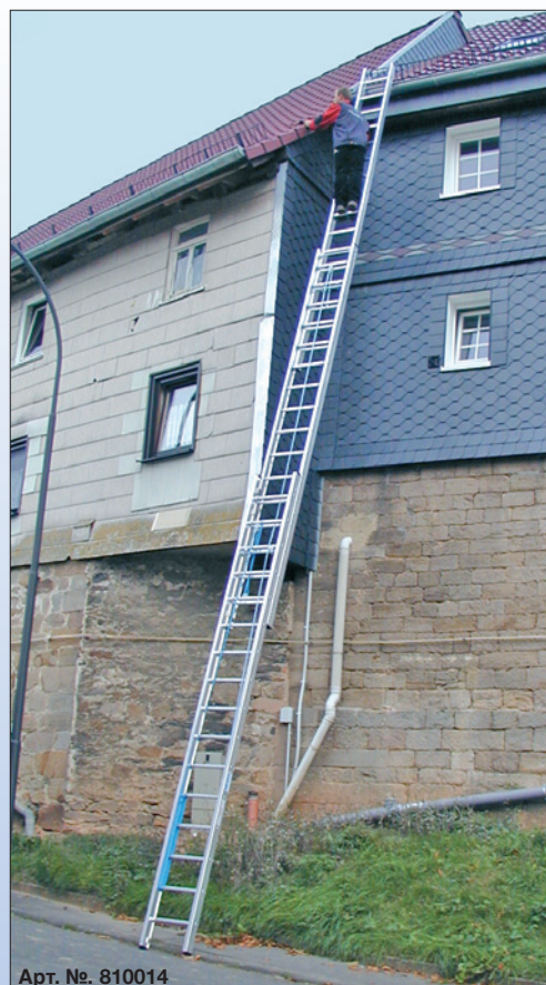
Арт. №. 810014