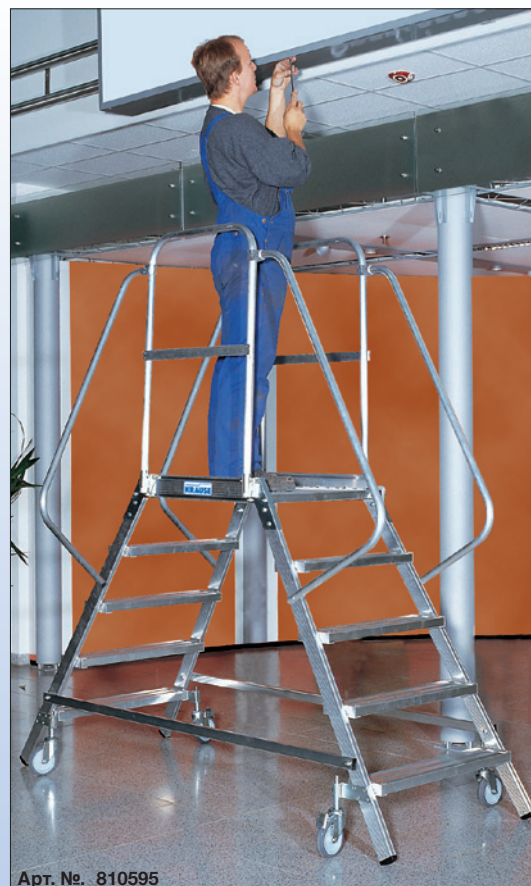
Арт. №. 810595