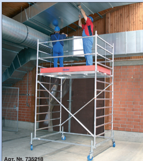
Арт. №. 735218