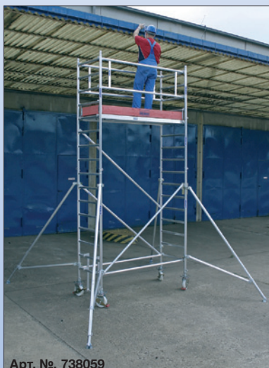
Арт. №. 738059