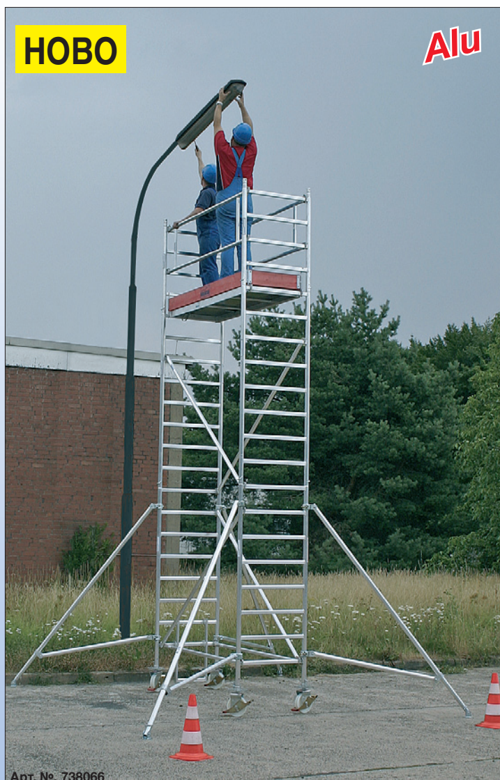
Арт. №. 738066

Важно: Според варианта на конструкцията трябва да се използват товарни тегла (принадлежности). Данните за товарите ще намерите в упътването за монтаж и употреба или на нашата страница в интернет.