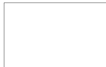
Предна крепежна шина